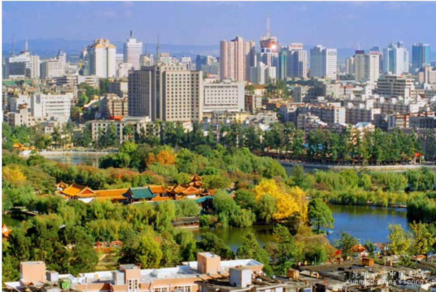
Photo de la ville